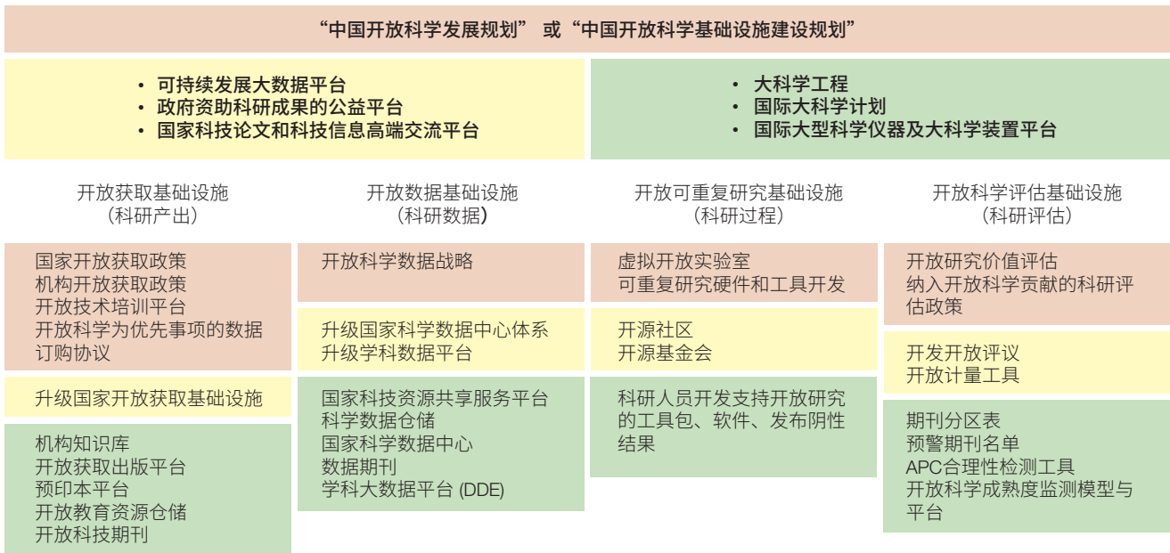
图3 基于我国开放科学路线图的开放科学基础设施治理行动